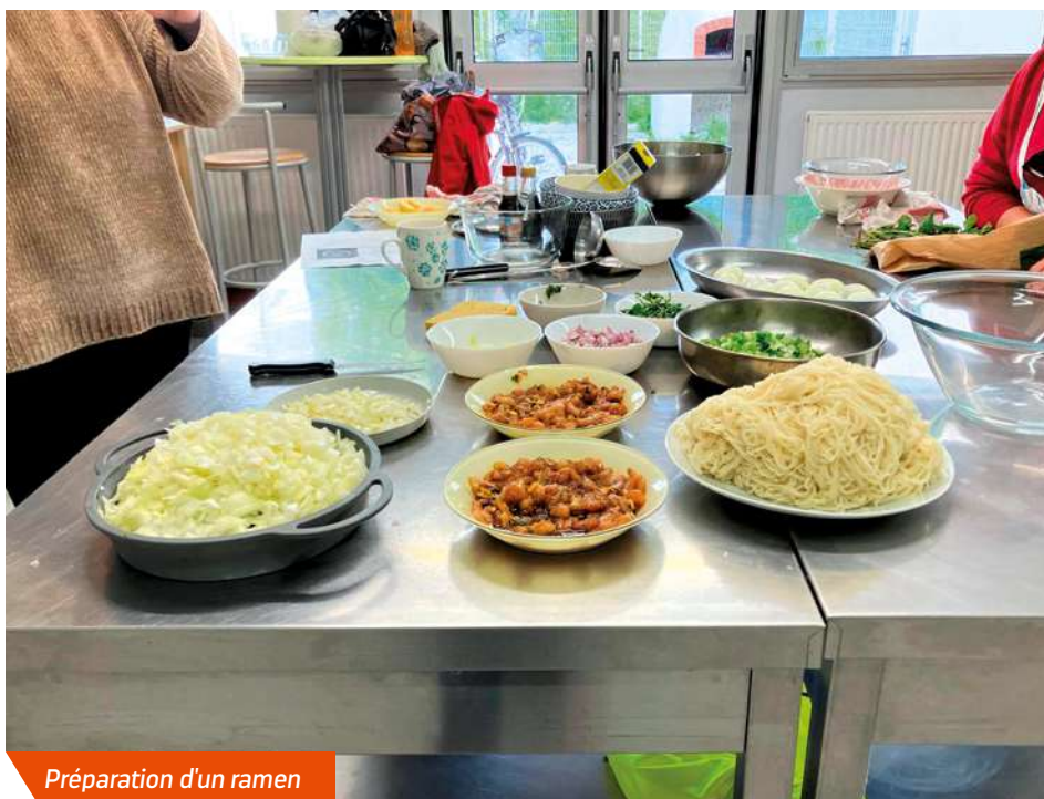
Préparation d'un ramen