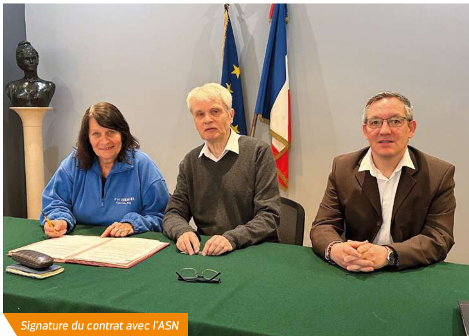
Signature du contrat avec l'ASN