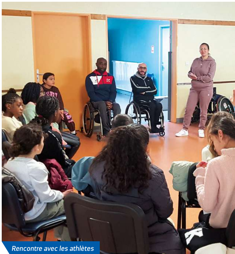
Rencontre avec les athlètes