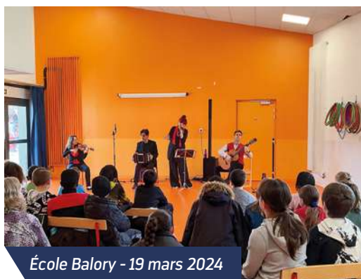
École Balory - 19 mars 2024