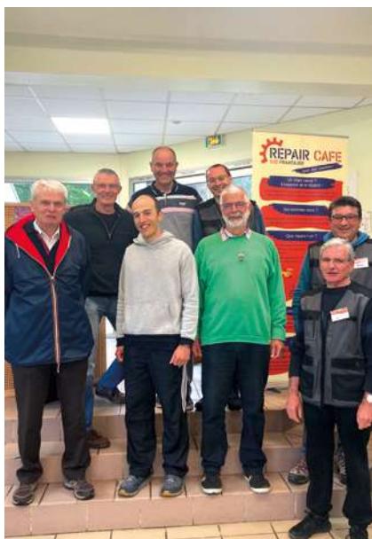
10 ans du Repair Café

L'association a fêté ses 10 ans d'existence le 1 er juin ! Merci à tous les bénévoles pour les objets réparés et les déchets évités ! ■