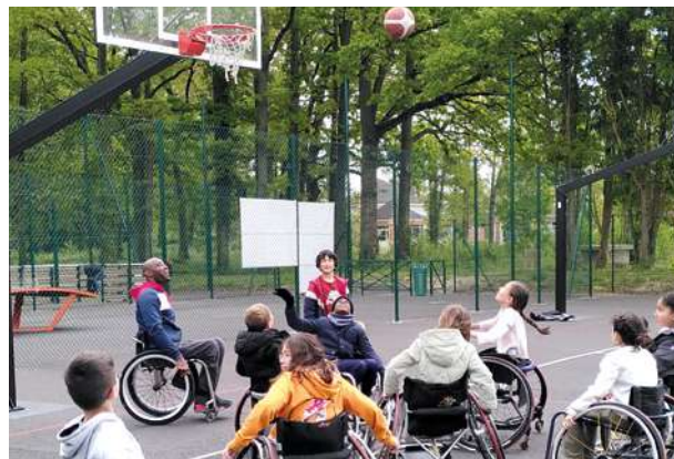
Sensibilisation au handicap au centre de loisirs