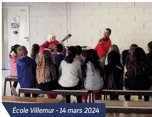
École Villemur - 14 mars 2024