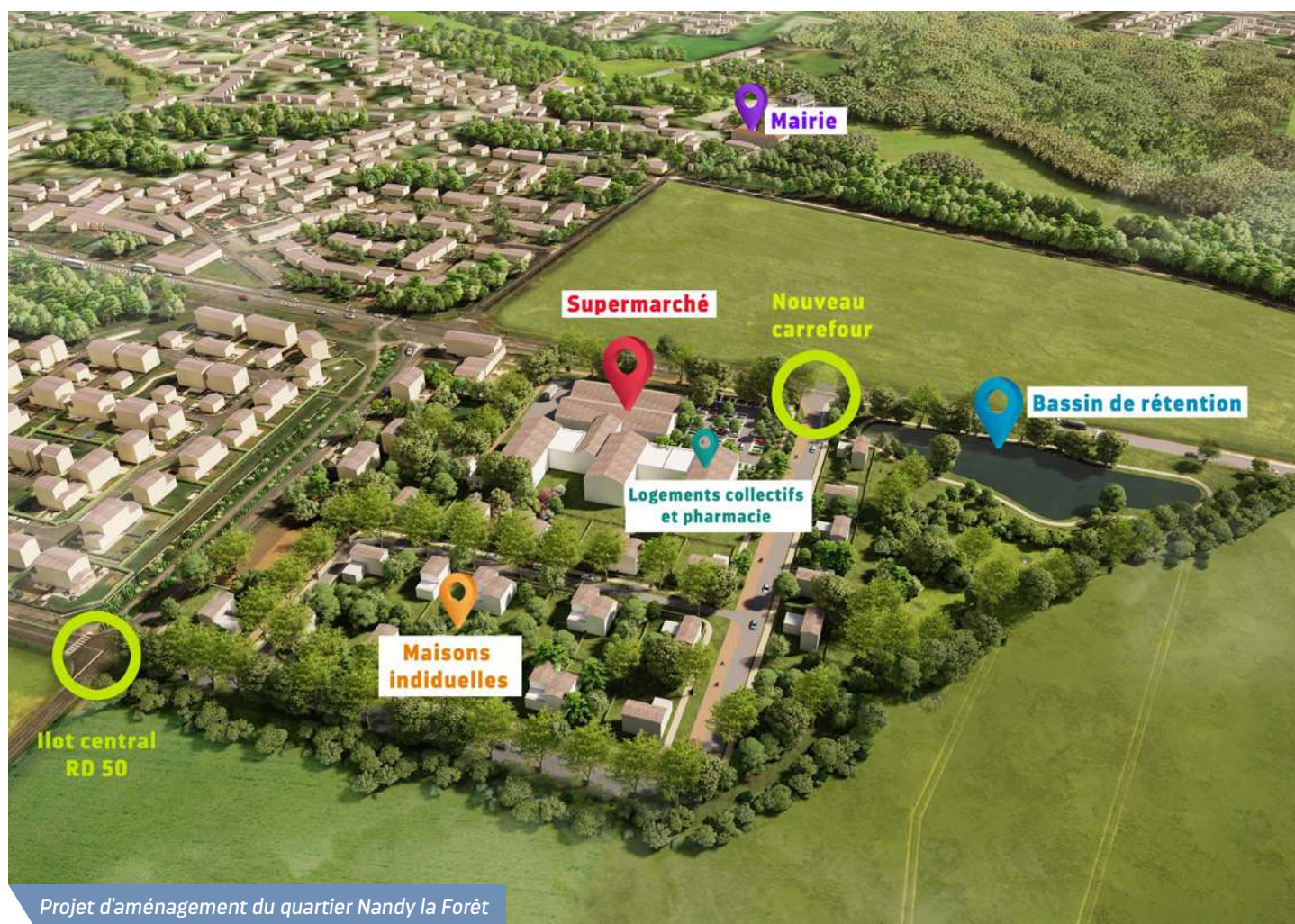
Projet d'aménagement du quartier Nandy la Forêt

Le permis d'aménager une parcelle du quartier sud vient d'être déposé à la Mairie.