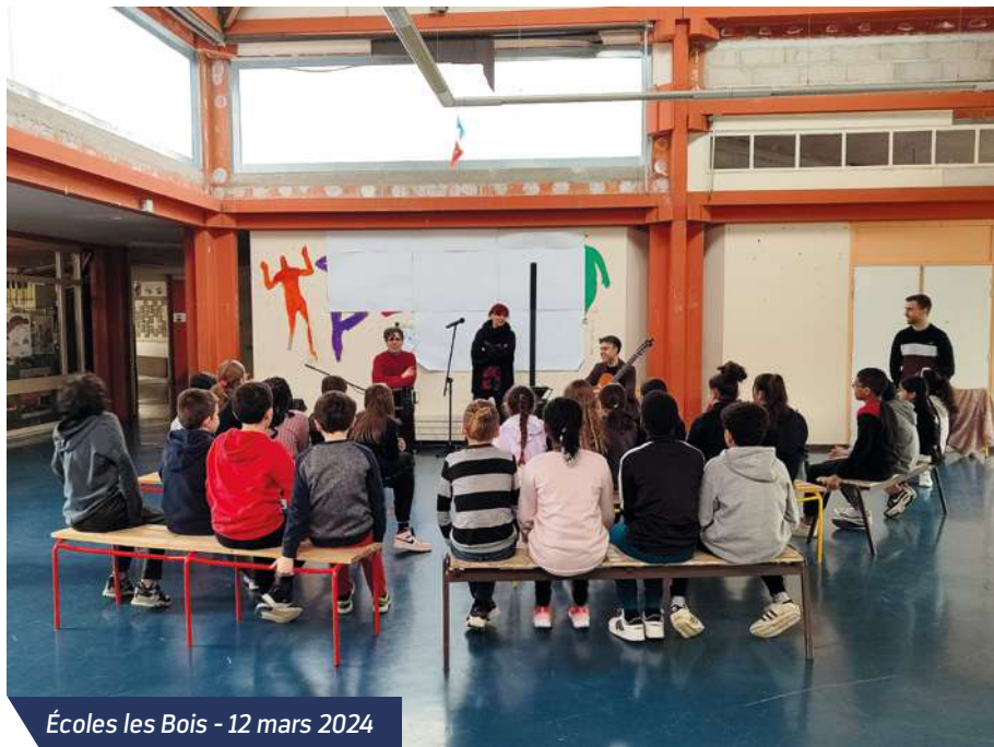
Écoles les Bois - 12 mars 2024