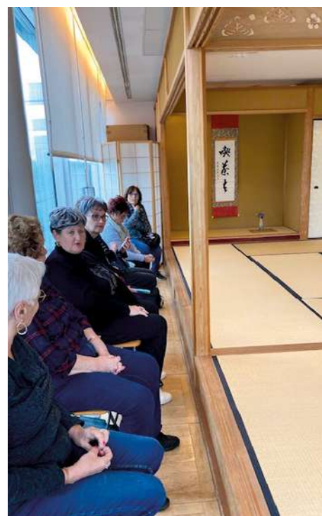
Visite de la Maison du Japon à Paris

Enfin, ils ont réalisé une œuvre collective en papier représentant une Geisha. ■