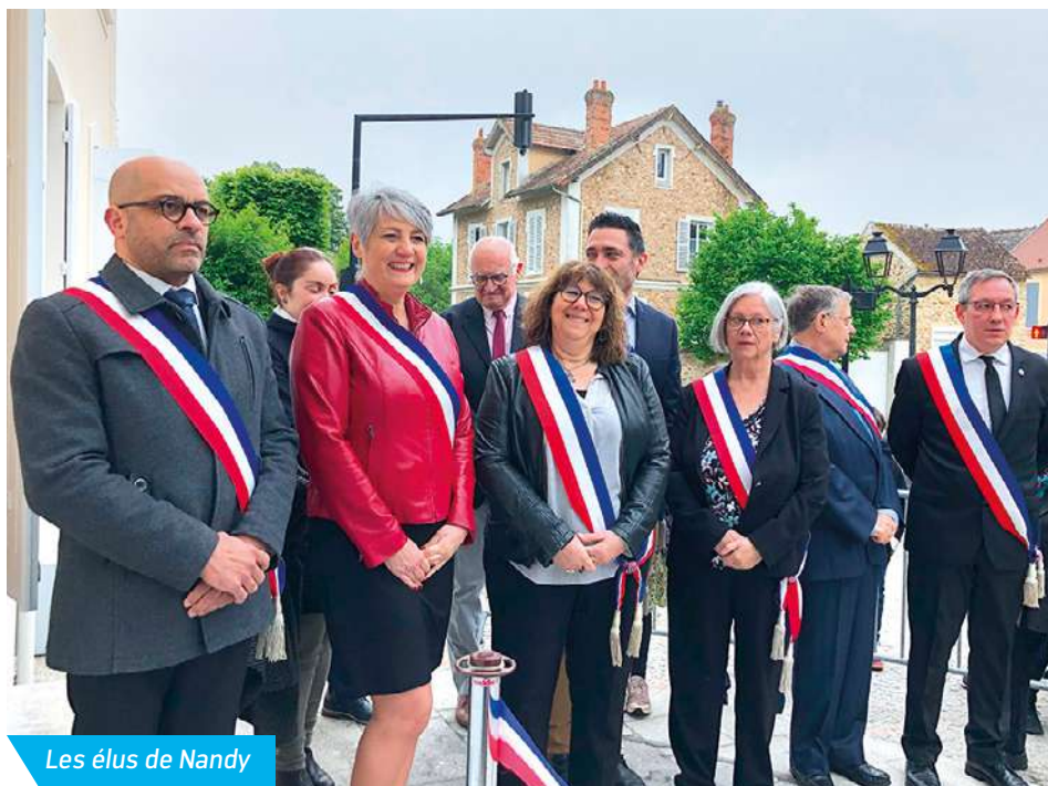
Les élus de Nandy

À l'issue de la coupure du ruban tricolore par les enfants du CME, les nandéens qui se sont déplacés à l'occasion de la cérémonie du 8 mai et de l'opération Portes ouvertes ont pu visiter les espaces de travail ainsi que le Bureau du Maire ! Le verre de l'amitié les attendaient. Les habitants ont apprécié la rénovation. ■