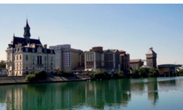
Hôtel de Ville et Grands Moulins de Corbeil, Corbeil-Essonnes