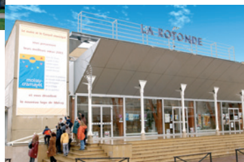
La Rotonde, Moissy-Cramayel