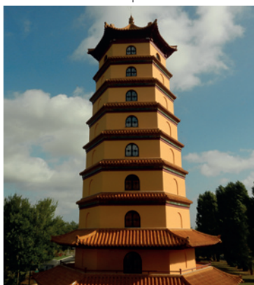
Pagode Khanh Anh, Evry-Courcouronnes