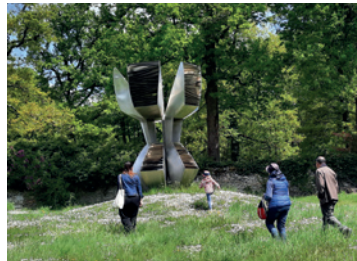
Sculpture de Dietrich-Mohr, Faisanderie de Sénart, Etiolles

19h00-20h30. Tout public. Sur réservation Faisanderie de Sénart Renseignements et réservations : tourisme-grandparisud.com rubrique « agenda » ou visite.gps@gmail.com Payant Office de Tourisme Grand Paris Sud