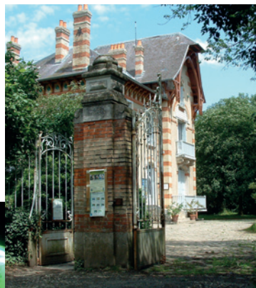
Maison de l'Environnement, Vert-Saint-Denis

14h-18h et 19h-21h. Tout public Domaine de la Grange-la-Prévôté ou au Millénaire en cas de mauvais temps Renseignements : 06.30.27.63.61 ou 06.71.73.20.70 ou association-amis-chateau-la-grange.fr Association Savigny sans frontières & Association des Amis du Château de la Grange