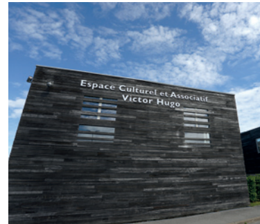
Espace Victor Hugo, Saint-Germain-lès-Corbeil

Du samedi 14 septembre au samedi 19 octobre aux horaires d'ouverture du lieu