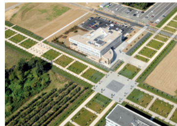
Carré Sénart, Lieusaint

13h-16h. Tout public Hôtel d'agglomération, 9 allée de la Citoyenneté Renseignements : 01.64.13.17.36 ou archives@grandparissud.fr