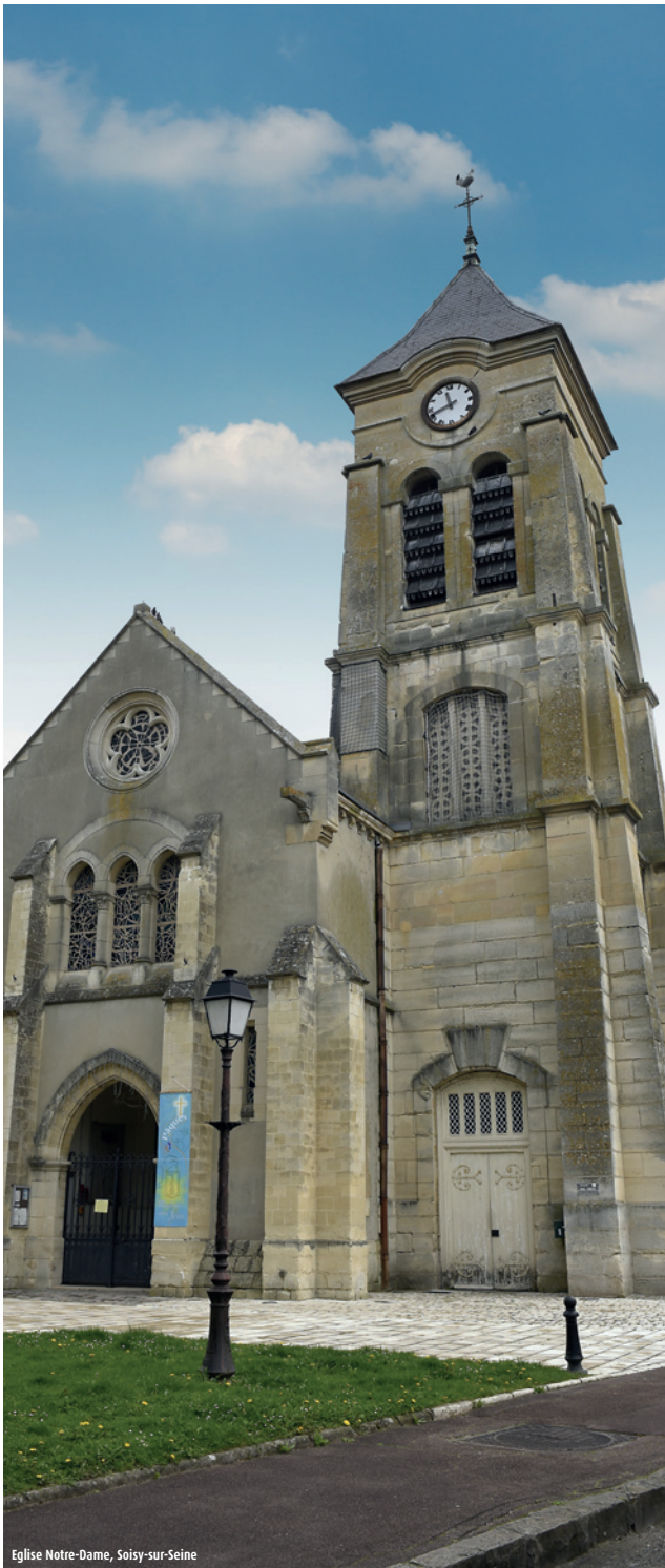
Eglise Notre-Dame, Soisy-sur-Seine