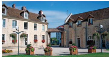
Ferme neuve, Grigny