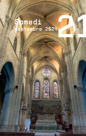
Eglise Saint-Vincent, Saint-Germain-lès-Corbeil